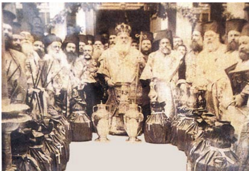
Ἡ τελετὴ τοῦ Ἁγίου Μύρου 1912 Ἐπὶ Ἰωακείμ Γ'

Ἴδου ἡ φωτογραφία τοῦ «Πατριάρχου» Ἰωακείμ καὶ τῆς Συνόδου τοῦ Οἰκουμενικοῦ Πατριαρχείου ὀλίγον μετὰ τὴν τέλεσιν τοῦ Ἁγίου Μύρου τὴν Μεγάλην Πέμπτην τοῦ 1912.